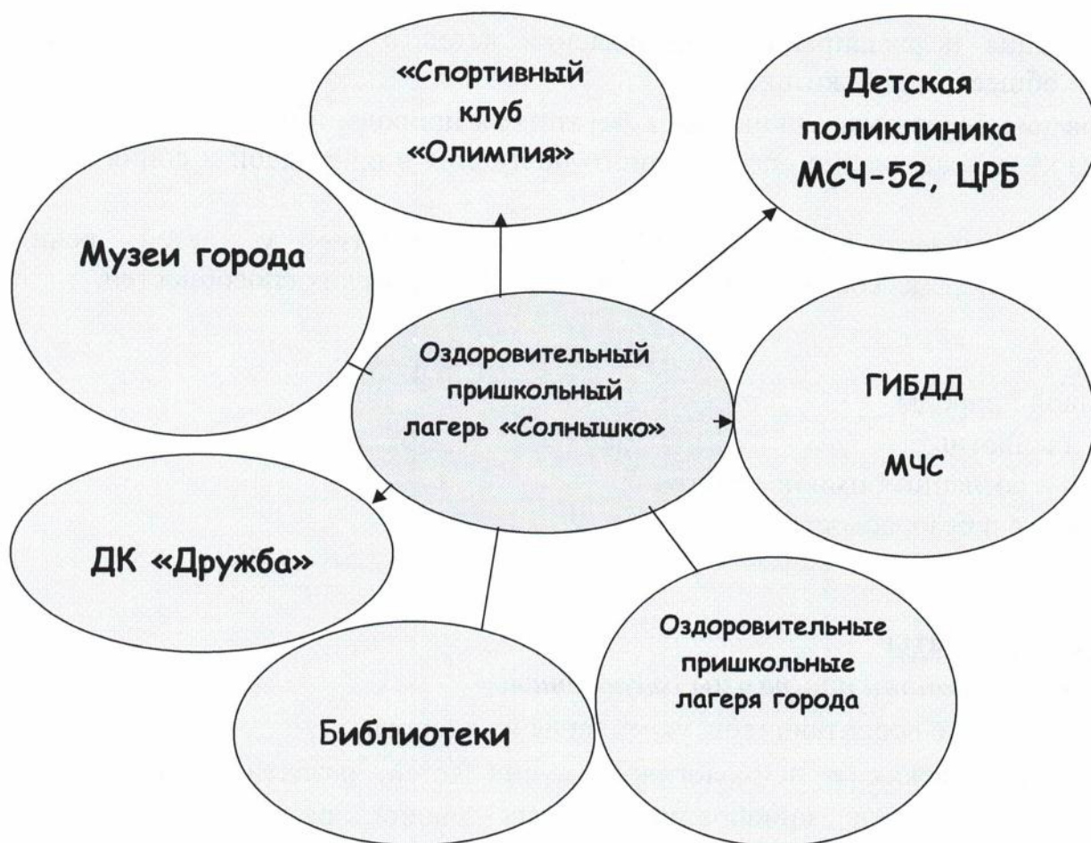
СХЕМА УПРАВЛЕНИЯ ПРОГРАММОЙ